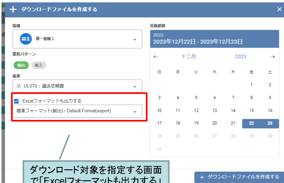
ダウンロード条件指定画面

ダウンロード対象を指定する画面で「Excelフォーマットも出力する」にチェックを入れ、Excelフォーマットを選択します