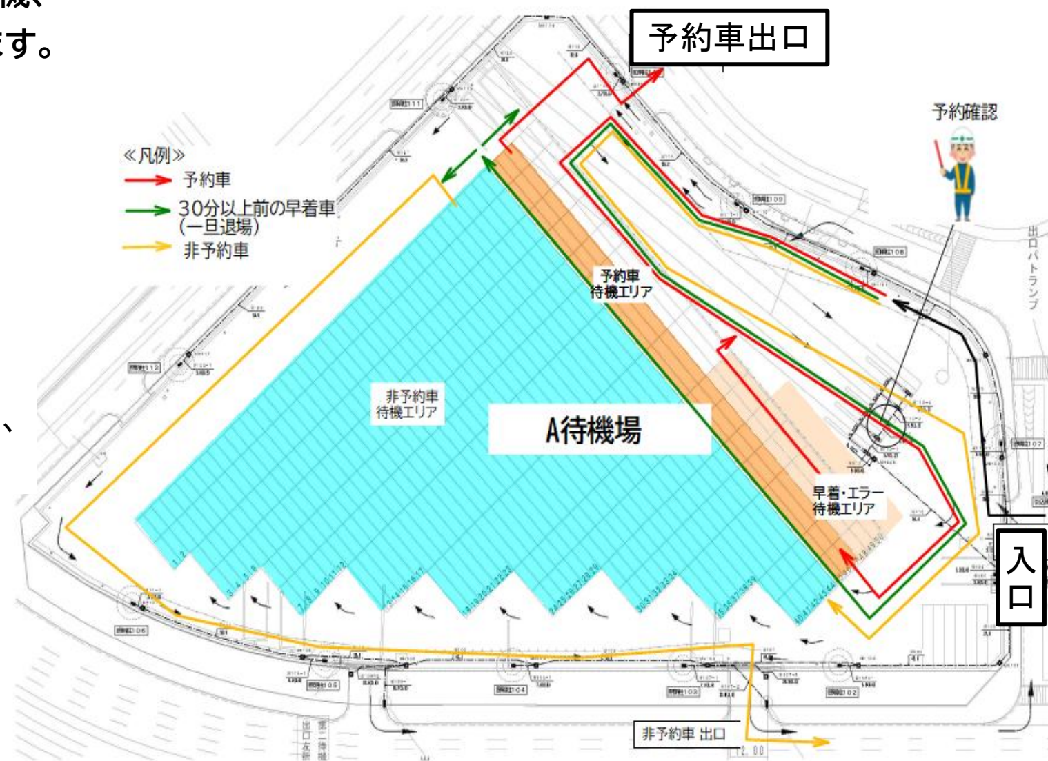
図 大井車両待機場Aでの走行ルート